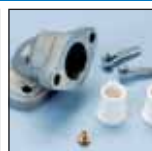
KIT MODIFICA RACING RACING POWER UNIT

144.004.016 144.004.016 144.004.016 144.004.016 144.004.016