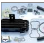
KIT RADIATORE OLIO 4 VALVOLE 4 VALVE RADIATOR OIL KIT