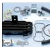
KIT RADIATORE OLIO 2 VALVOLE 2 VALVE RADIATOR OIL KIT