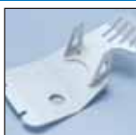
PROTEZIONE MOTORE ENGINE PROTECTOR