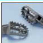
PEDANE RACING RACING FOOTRESTS