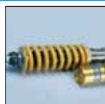
AMMORTIZZATORE OHLINS OHLINS SHOCK-ABSORBER

144.800.026 144.800.026 144.800.026 144.800.026