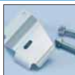
PROTEZIONE POMPA PUMP PROTECTOR

144.800.026 144.800.026 144.800.026 144.800.026